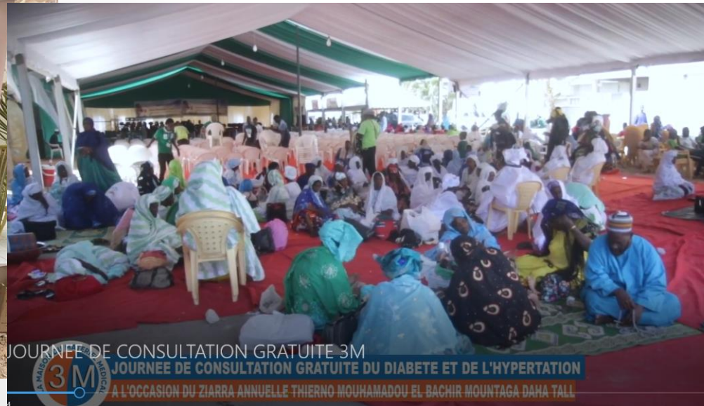
JOURNÉE DE CONSULTATION GRATUITE 3M JOURNÉE DE CONSULTATION GRATUITE DU DIABÈTE ET DE L'HYPERTENSION À L'OCCASION DU ZIARRA ANNUELLE THIerno MOUHAMADOU EL BACHIR MOUNTAGA DAHA TALL