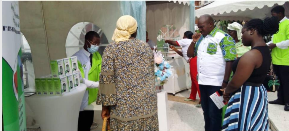
Journée d' Animation a la pharmacie Palm club