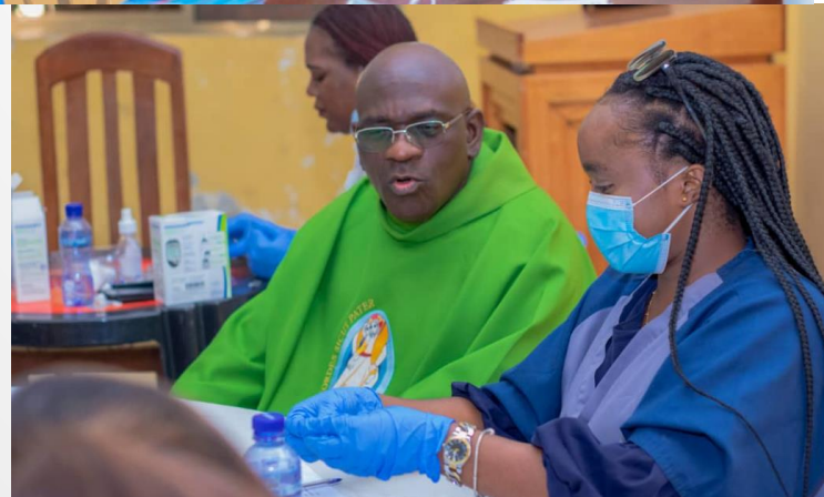
Partnership with SLD (local non-profit association)